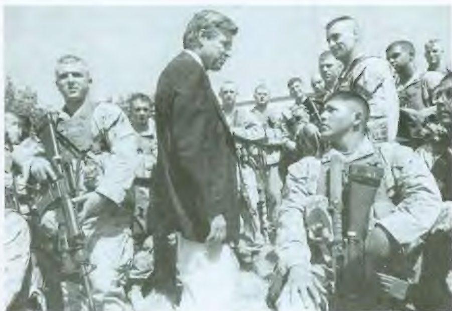
في أثناء استقبال رئيس الوزراء طوني بلير في البصرة